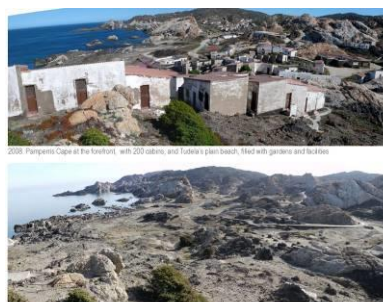
Projecte de restauració del Paratge Tudela-Culip al Parc Natural del Cap de Creus

Per a descarregar les imatges en alta resolució, feu clic sobre les mateixes.